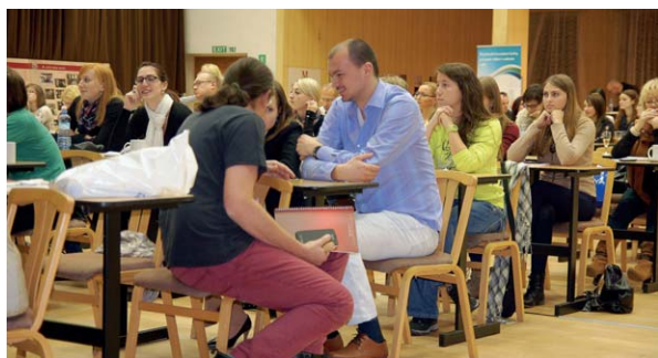
z kongresového sálu