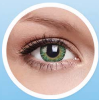
BAREVNÉ ČOČKY DIOPTICKÉ A NEDIOPTICKÉ

V případě dotazů, nebo zájmu o spolupráci se na nás neváhejte obrátit.