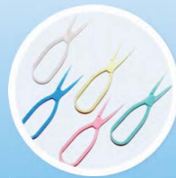
DOPLŇKY - APLIKÁTORY, KLEŠTIČKY, PINZETKY A POUZDRA