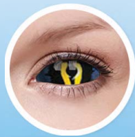
CRAZY ČOČKY DIOPTICKÉ, NEDIOPTICKÉ (DIA: 14,0; 17,0 A 22,0 - SKLERÁLNÍ)