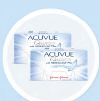
KONTAKTNÍ ČOČKY VŠECH VÝROBCŮ