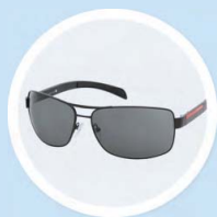
SLUNEČNÍ A DIOPTICKÉ BRÝLE RAY-BAN, PRADA, DOLCE&GABBANA A SPY+