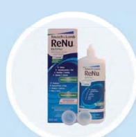
ROZTOKY NA KONT. ČOČKY

K dispozici máme katalogy brýlí SPY+, barevných a crazy čoček a ozdobných pouzder, které na vyžádání můžeme zaslat, nebo vám je doveze náš obchodní zástupce. Dále jsou k dispozici letáky, plakáty a samolepky k vybraným produktům.