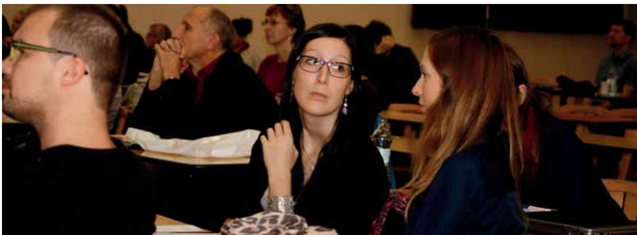
z kongresového sálu