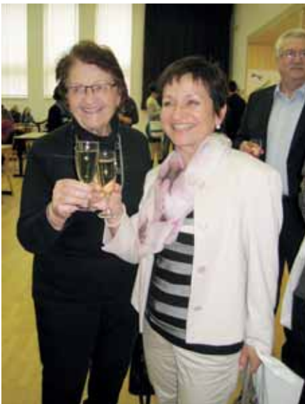
ze zahájení sjezdu