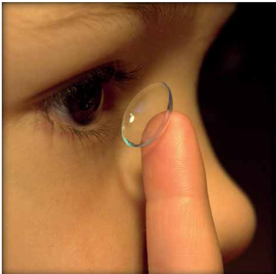
vítězná fotografie – fotosoutěž 2014