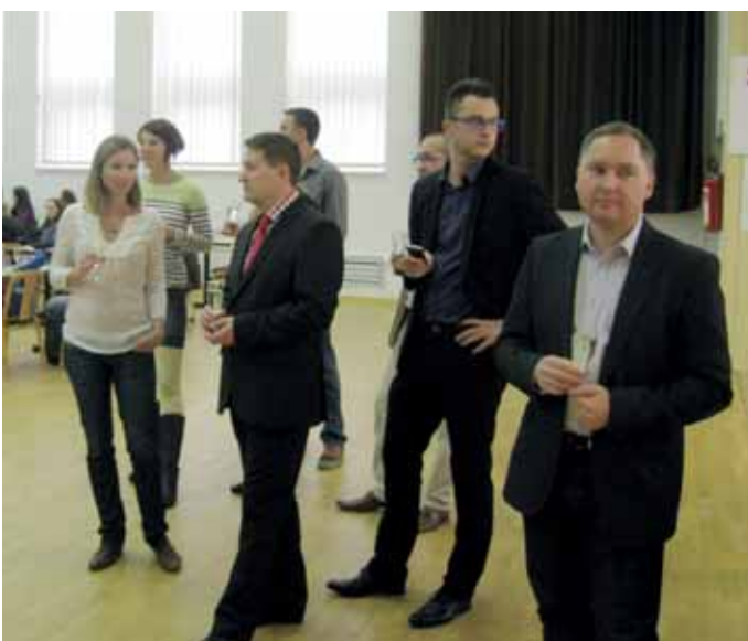
ze zahájení sjezdu