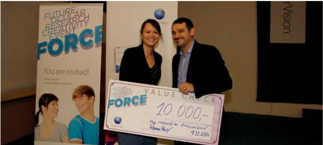
předávání ceny vítěze soutěže absolventských prací