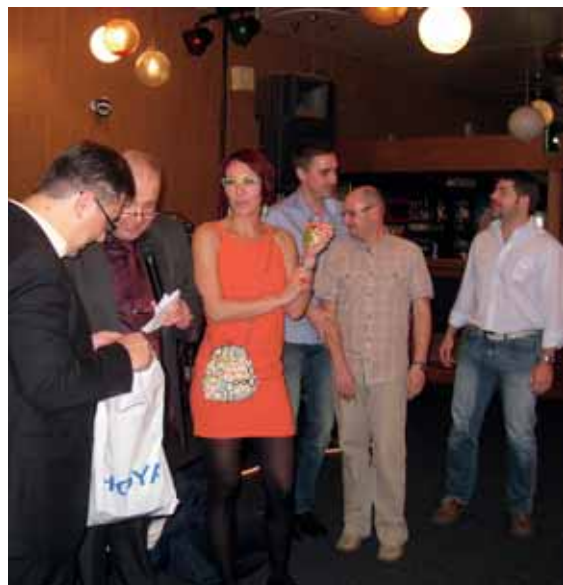
záhájení slavnostního večera