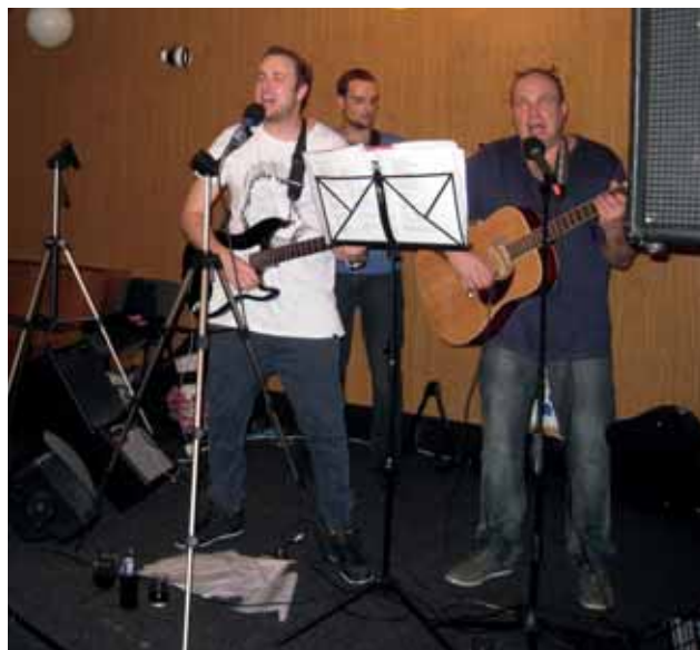
zábava z pátečního večera