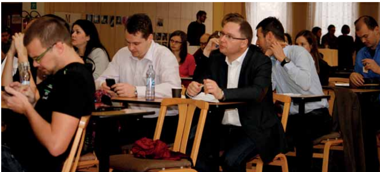
z kongresového sálu